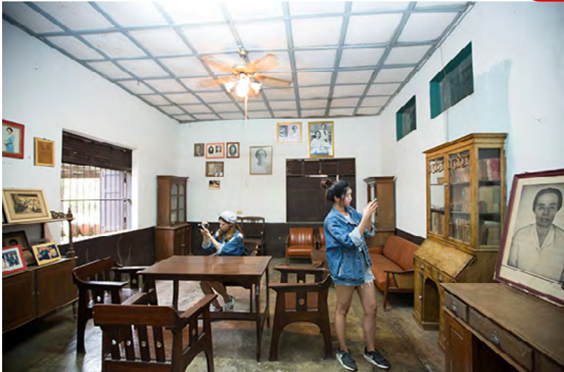
ภายในห้องรับแขกที่บ้านหลวงประเทืองคดี ยังคงภาพร่างสวยงามของเครื่องเรือน ตู้ไม้ กรอบรูป เล่าเรื่องราวของผู้เป็นเจ้าของ ที่ตกทอดผ่านคืนวันมาคู่บ้านวังกรด

The Nest Hotel Pichit ที่พักโมเดิร์นวินเทจ แสนสะดวกสบายในเมืองพิจิตร ถนนสระหลวง โทรศัพท์ ๐ ๕๖๐๓ ๖๐๐๐ เฟซบุ๊ก: The Nest Hotel Pichit