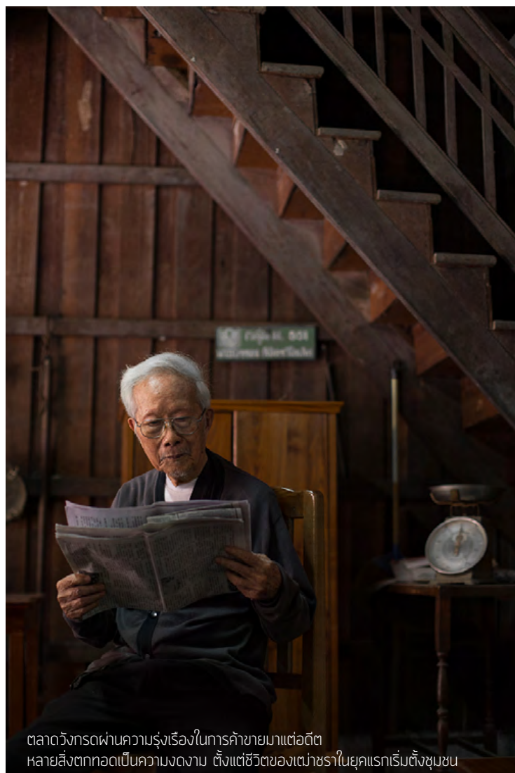
ตลาดวังกรดผ่านความรุ่งเรืองในการค้าขายมาแต่อดีต หลายสิ่งตกทอดเป็นความงดงาม ตั้งแต่ชีวิตของเข่าชราในยุคแรกเริ่มซึ่งชุมชน

| ฐากร โภมารกุล ณ นคร...เรื่อง