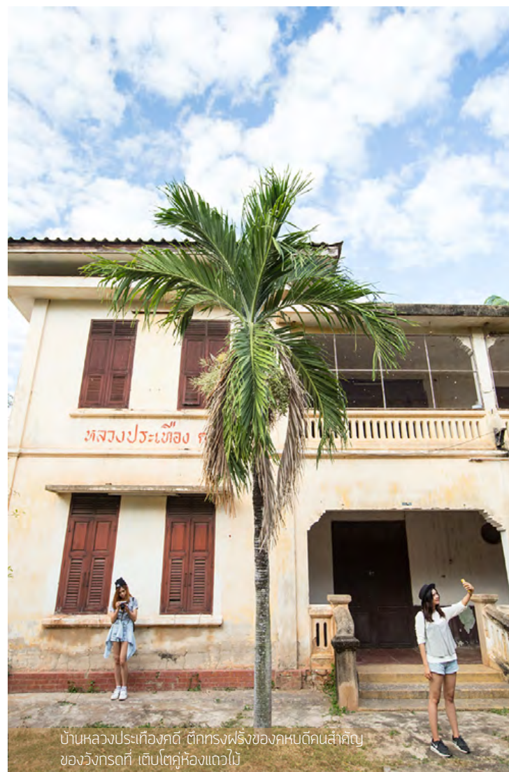
บ้านหลวงประเทืองคดี ตึกทรงฝรั่งของคหบดีคนสำคัญ ของวังกรดที่ เต็มไปด้วยห้องแถวไม้