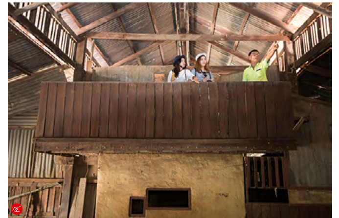
ซอยกลางคือย่านตลาดเก่าแก่ยุคแรกเริ่มของวงกรต ร้านค้าต่าง ๆ เคยแน่นขนัด บางร้านยังคงเปิดขายอย่างสมบูรณ์โอสถ (ภาพ ๑) ลูกหลานบางคนเปิดบ้านเป็นศูนย์ข้อมูลเรียนรู้ (ภาพ ๒) ขณะที่ซอยโรงหนังที่เก่าแก่ไปต่างกับ ทุกวันนี้จึงยวบยาบ ปรากฏเป็นตึกเก่าหลายทรง (ภาพ ๓) และโรงหนังมิตรบรรเทิง แหล่งรับชมยี่ที่เคยเนื่องแน่นผู้คน (ภาพ ๔)

"แต่ก่อนหนัง ๑๖ มม. นี่ต้องหนังดาราคู่ขวัญอย่างมิตร-เพชรรา" เฮียว่าเรื่องมนต์รักลูกทุ่ง อินทรีแดง หรือเงินเงินเงิน นี่ฉวยวนไม่รู้กี่รอบต่อกี่รอบ