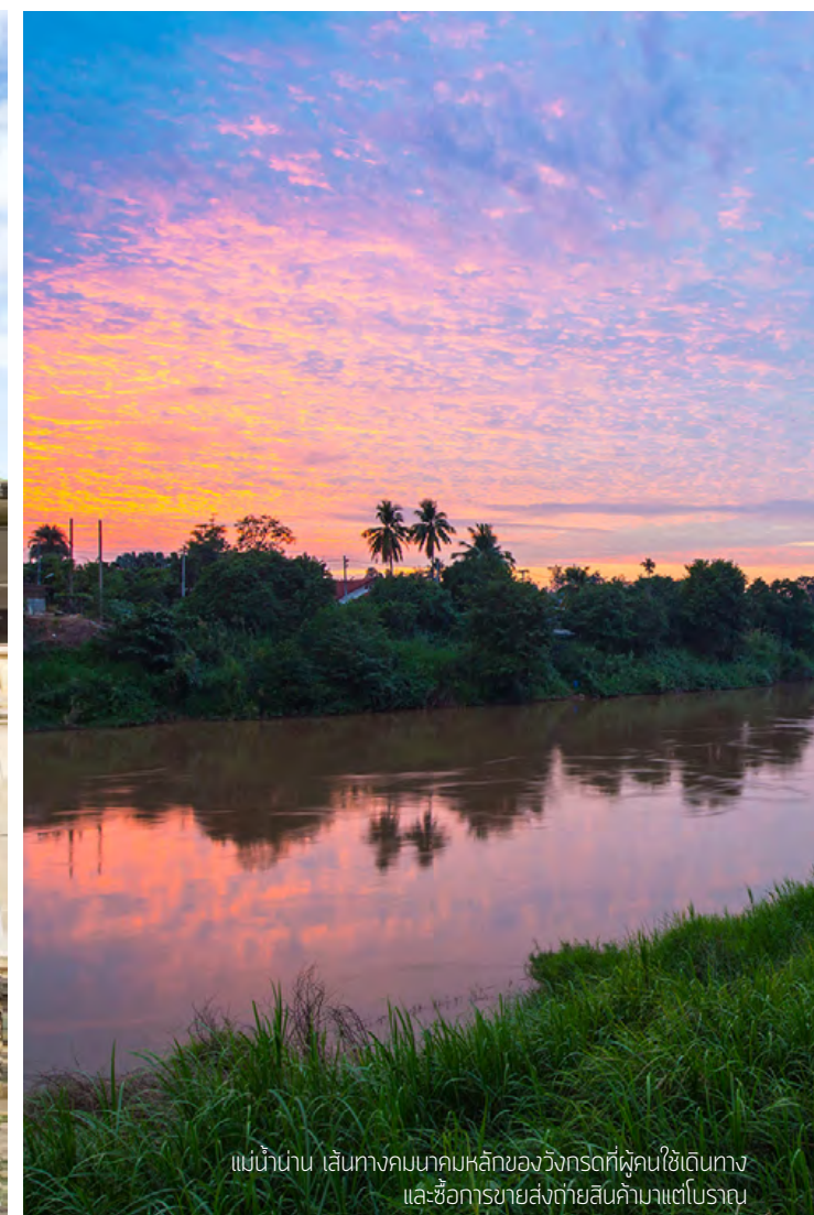
แม่น้ำน่าน เส้นทางคมนาคมหลักของวังกรดที่ผู้คนใช้เดินทาง และซื้อการขายส่งถ่ายสินค้ามาแต่โบราณ