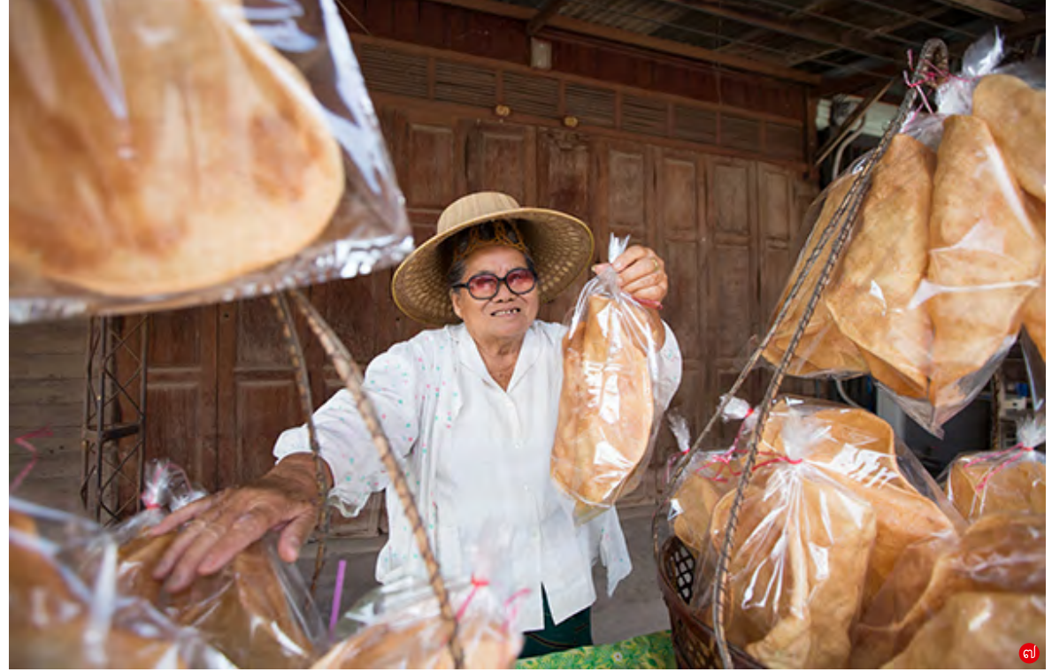
ของกินเก่าแก่ที่นับเป็นเสน่ห์และเล่าเรื่องราวของวังกรดได้อย่างดี ก๋วยเตี๋ยวต้มยำพริกสดใช้ชุมชนเด็ดเผ็ดร้อน (ภาพ ๑-๒) ลากูของผสมควว ที่เนื้อแน่นนุ่มใส (ภาพ ๓) ผัดไทยเจี๊ยงสูตรโบราณ (ภาพ ๔) กาแฟโบราณร้านพื้นทิวทัศน์ ที่ไม่เพียงอร่อย แต่ได้บรรยากาศเก่าแก่ (ภาพ ๕) ปลาแม่น้ำแดดเดียวและข้าวเกรียบว่าวของลุงป้าแถบบ้านเหนือก็อร่อยได้ในวันหยุด (ภาพ ๖-๗)