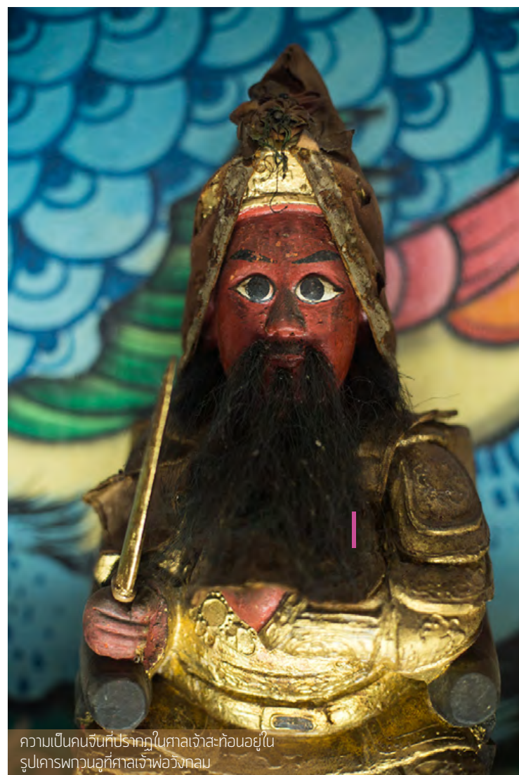
ความเป็นคนจีนที่ปรากฏในศาลเจ้าสะท้อนอยู่ใน รูปเคารพกวนอูที่ศาลเจ้าพ่อวังกลม